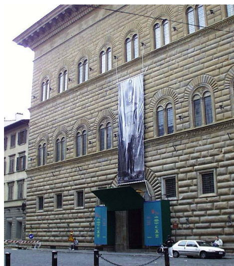
Nuovo Rinascimento ON-NS&A Palazzo Strozzi -Firenze

Le scelte strategiche di cambiamento futuro della "Creative Class-Net" trovano radici in un ritorno al passato dello sviluppo rinascimentale in cui la separazione tra scienza arte e umanesimo non era stata ancora perpetrata da criteri di efficienza "meccanici", che in seguito hanno dato origine alla societa industriale . Infatti cosi' come il Rinascimento Fiorentino interpreto' sensibilmente il vecchio approccio umanistico di origine Aristotelica, riconsiderando e ricostruendo in una nuova prospettiva artigianale il rapporto tra scienza ed arte , similmente la comunicazione tra arte e scienza , agli inizi del III°Millennio, riproduce il fondamentale grado di innovazione