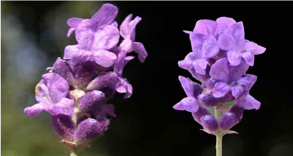
Florentine Creativity for a new Measurement of Humanity Program : http://www.fungoceva.it/erbe_ceb/image_erbe/lavanda3.jpg